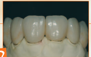
12 Lavoro ultimato dal Sig. D. Rondoni