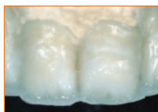
Applicazione dentine HFO