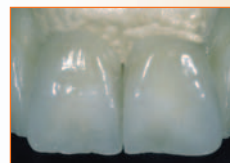
Smalti generici e opalescenti