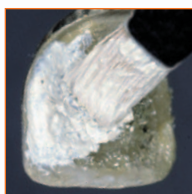
Tender paste opaque