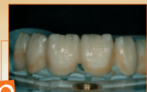
10 Opalescenze, intensivi e caratterizzazioni