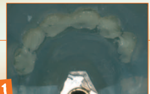
11 Zeppatura smalto e riapertura muffola