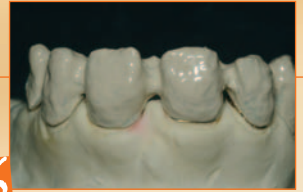
6 Primer e opaco