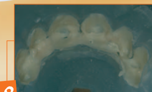
8 Zeppatura dentina HFO