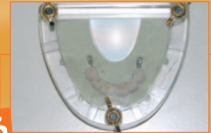
3 Controstampo in silicone trasparente per smalto