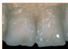
Intensivi & caratterizzazioni