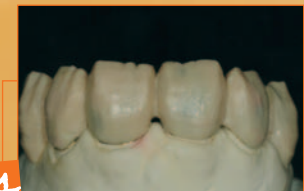
4 Tagli dentinali ceratura per secondo controstampo