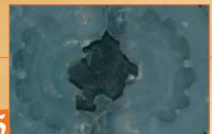
5 Stampi in silicone per dentina e smalto*