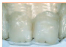
Dentine opache Tender

Il grado di adesione tra metallo e composito risulta molto elevato grazie al "Tender Bond" metal primer e al nuovo opaco in pasta, "Tender paste opaque".