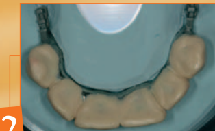
2 Fissaggio in muffola silicone 95 shores