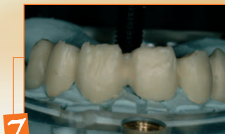
7 Stratificazione Tender